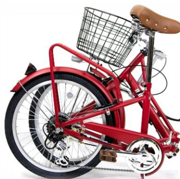
折り畳み時サイズ：約D83×W36×H66cm