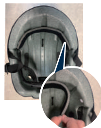
サイズ調整用 インナーパッド